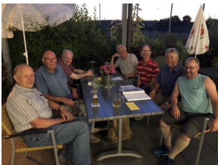
Foto: Gemütliches Beisammensein der „Schachveteranen“ der GSV am 12.08.2022 auf der unteren Terrasse des Clubhauses:

Im Sommer trafen sich die „Schachveteranen“ der GSV zu einem kleinen Wiedersehen im Clubhaus.